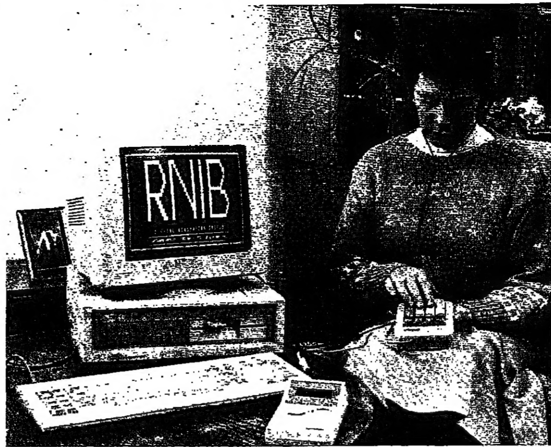
طريقة الكتابة والقراءة